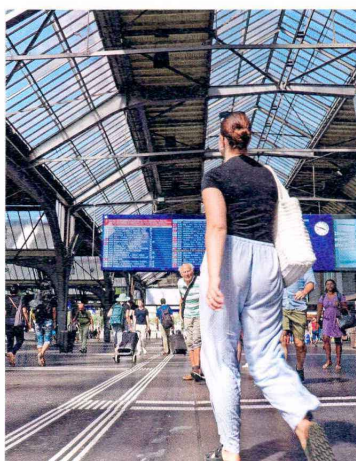
Wer die Anzeigetafel am Bahnhof nur mit Mühe oder überhaupt nicht lesen kann, ist in seiner Mobilität stark eingeschränkt.